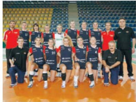
CAMPIONESSE Qui sopra l'under 14 in festa a Castellana Grotte. A destra, la formazione dell'under 18 che si è imposta a Termoli

■ Sassuolo L'ANDERLINI & Sassuolo Volley piazza una incredibile doppietta, aggiudicandosi sia lo scudetto Under 18 nella finalissima di Termoli, dove era tra le attese protagoniste, che quello delle Under 14 conquistato a Castellana Grotte, dove le modenesi non godevano certo del favore del pronostico: mai una società femminile modenese era riuscita a vincere due titoli nella stessa stagione, anzi per la verità prima di quest'anno erano solo due i titoli giovanili vinti da squadre modenesi, ed il risultato fa il paio con la doppietta maschile (Under 16 ed Under 14), conquistata dalla Scuola di Pallavolo Anderlini tre anni fa.